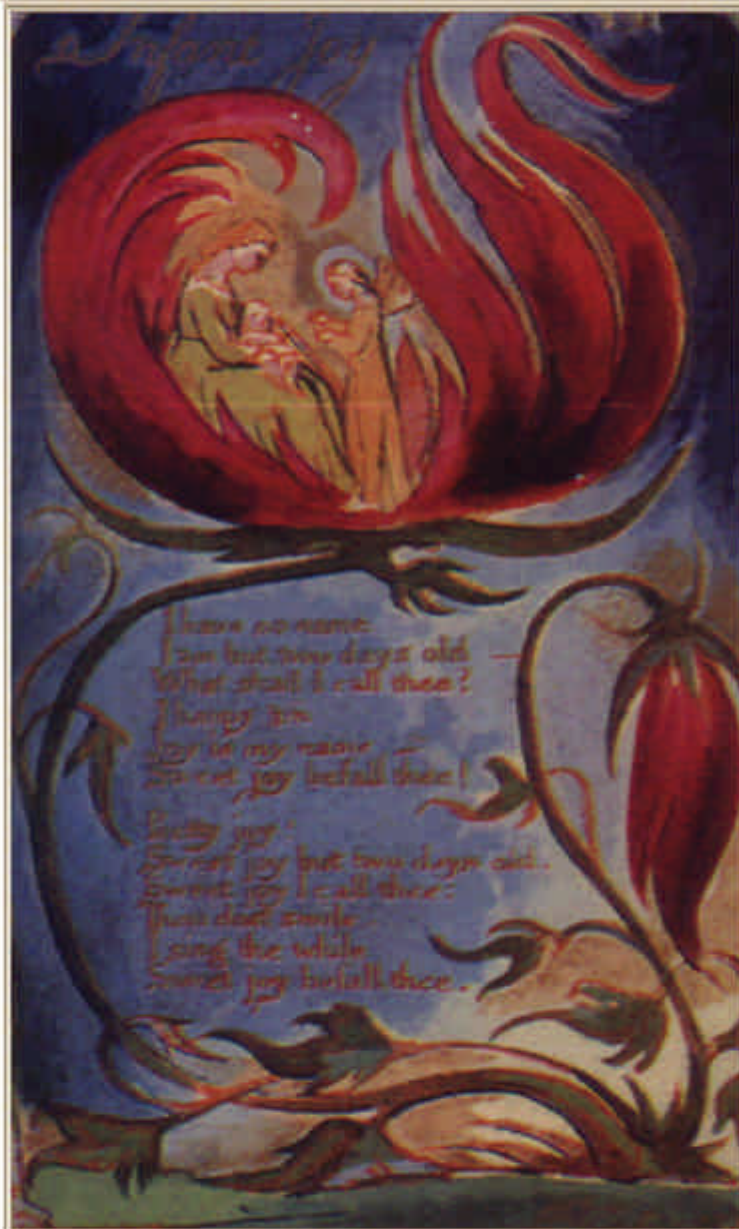
Ilustración de William Blake para Alegria Infantil, en Cantares de Inocencia (1789)