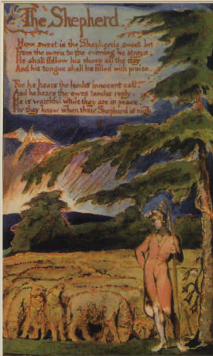
Ilustración de William Blake para El Pastor, en Cantares de Inocencia (1789)